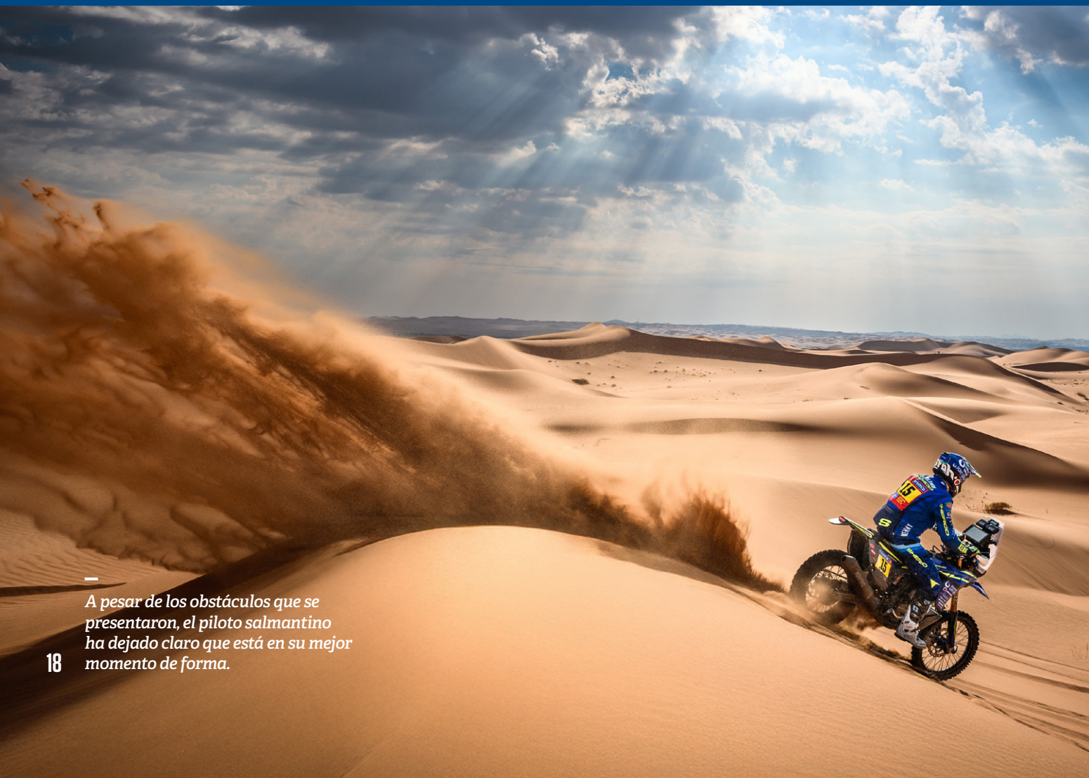
A pesar de los obstáculos que se presentaron, el piloto salmantino ha dejado claro que está en su mejor momento de forma.

El Dakar es, sin duda, una de las pruebas más duras y complejas del motociclismo mundial. Y aunque los resultados finales no siempre reflejan el esfuerzo y las emociones vividas durante las interminables jornadas en el desierto, el salmantino ha dejado claro que está preparado para seguir luchando y alcanzando nuevas metas en su carrera.