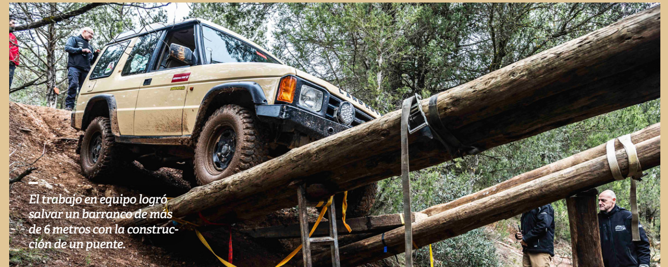
El trabajo en equipo logró salvar un barranco de más de 6 metros con la construcción de un puente.

El viernes marcó el inicio de la experiencia para los 12 equipos participantes del Trophy Classic en Masía Pelarda. Tras pasar las verificaciones técnicas de los vehículos, recibir el pack de bienvenida y colocar las pegatinas oficiales, comenzó la primera prueba: un desafiante roadbook nocturno que puso a prueba la orientación y las habilidades de navegación de los equipos, evocando los retos que enfrentaban los pioneros del todoterreno.