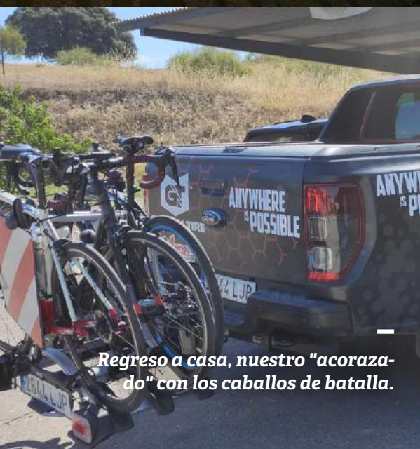
Regreso a casa, nuestro "acorazado" con los caballos de batalla.