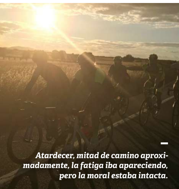
Atardecer, mitad de camino aproximadamente, la fatiga iba apareciendo, pero la moral estaba intacta.