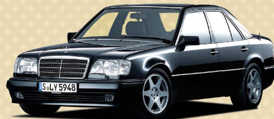
NEUMÁTICOS: MICHELIN PRIMACY 3.

El proceso de producción duraba 18 días y cada 500 E hacía dos veces el viaje de Zuffenhausen a Sindelfingen, dos de las factorías históricas de la marca. Empezaron fabricándose diez al día y hubo que doblar producción por la alta demanda. Hoy son modelos cotizados, especialmente la serie Limited de 500 unidades.