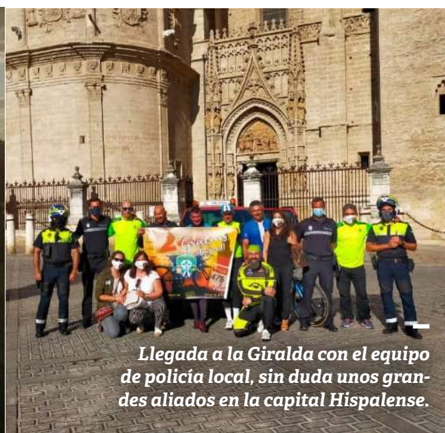
Llegada a la Giralda con el equipo de policía local, sin duda unos grandes aliados en la capital Hispalense.