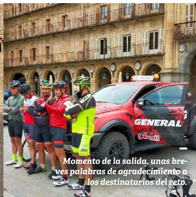
Momento de la salida, unas breves palabras de agradecimiento a los destinatarios del reto.