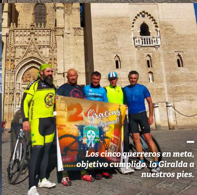
Los cinco guerreros en meta, objetivo cumplido, la Giralda a nuestros pies.